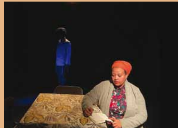
צילום: נקט בנקיר

תהילה ישעיהו-אדגה כתיבה, בימוי | טזיטה טשלה, חנוך וובה, נועה נירן, תהילה ישעיהו-אדגה שחקנים | גבריאלה לב יעוץ אמנותי | טזיטה טדלה תרגום | רונית רולנד מוזיקה | נהוראי לוידור תאורה גילי עזרן תלבושות | הדס קדרון עוזרת במאי