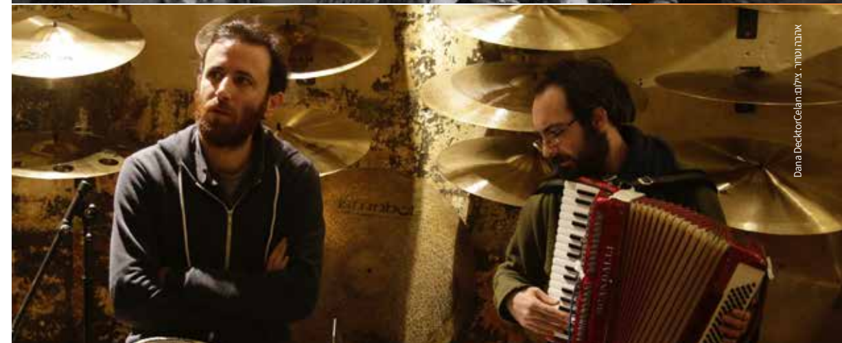
אתר: דאָו בּוֹב, צילום: דאָנא דאקטור סאן, Dana Decktor

רביעי | 21:30 | מזקקה, רח' שושן 3, ירושלים الثلاثاء | 21:30 | ميزكاكا، شارع شوشان 3، القدس Wednesday | 21:30 | Mizkaka, 3 Shushan Street, Jerusalem