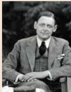
ת"ס אליוט