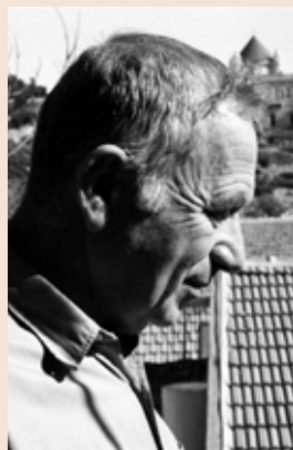
יהודה עמיחי