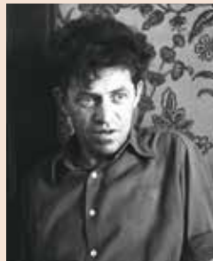
אמיר גלבוע.