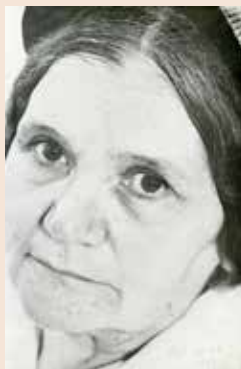
זלדה.