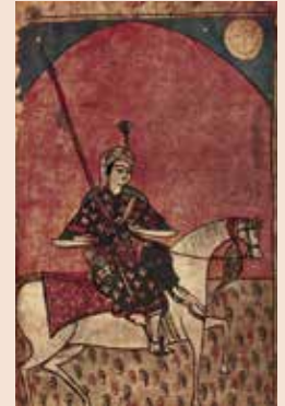
ציור החצר של המלך ליוואל השני, 1646 איור מקורי של מאמנה תאוצאכאשווילי