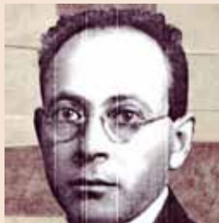
דוד פוגל