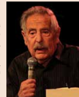
חיים גורי