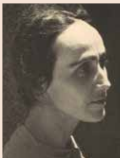
יוכבד בת מרים