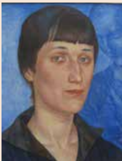
אנה אחמטובה. ציור: Kuz'ma Petrov-Vodkin, 1922