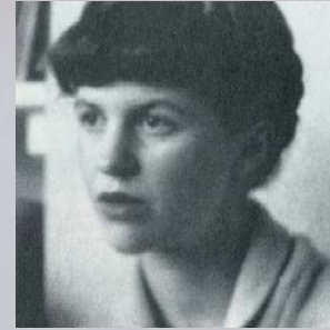
סילביה פלאת.