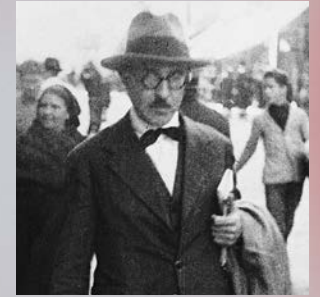
פרננדו פסואה. צילום: מתוך ויקיפדיה, אמן לא ידוע

צ'לו: אווה מעזיה כלי נשיפה עממיים: איליה מעזיה