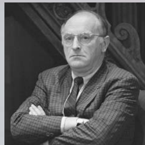
יוסף ברודסקי.

המשורר מירון ח. איזקסון יקריא וידבר על קהלת, ולאחר מכן יתקיים מופע מוזיקלי מאת קורין אלאל.