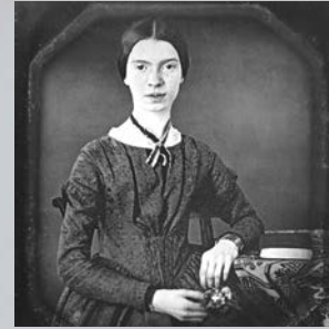
אמילי דיקנסון.