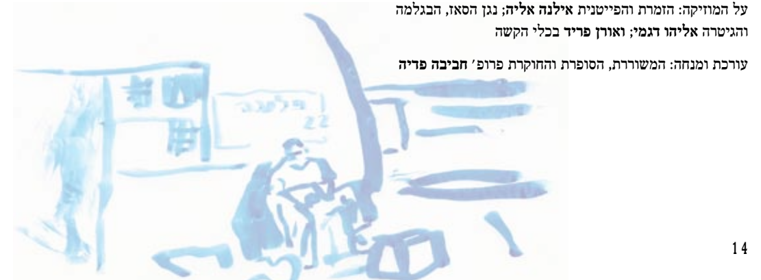
אירת פאת הרב פנחס חרדי לירבית אסנת

עורכת ומנחה: המשוררת, הסופרת והחוקרת פרופ' חביבה פדיה