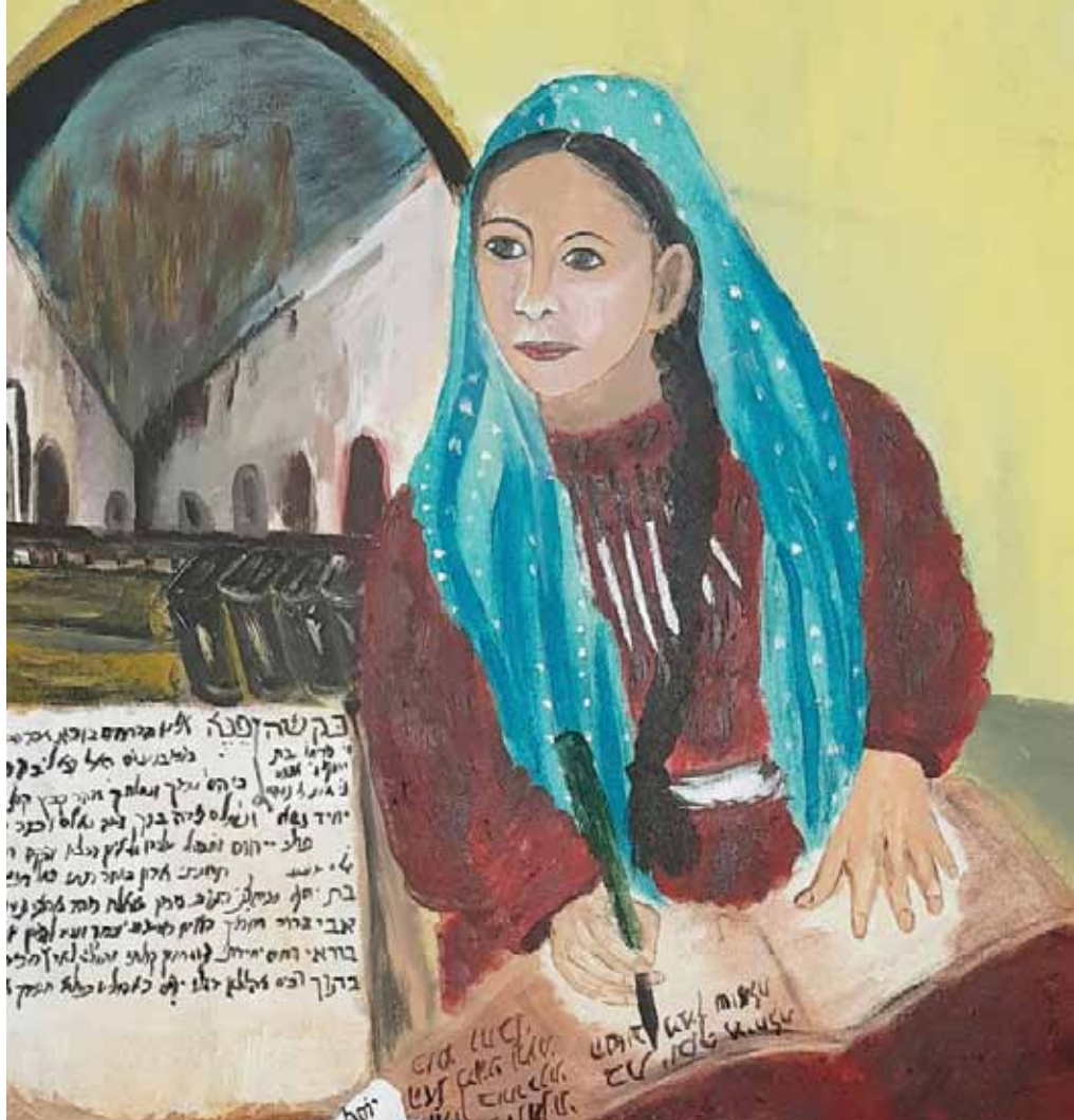
פריחא בת־יוסף, ציור: אייזבע שטרית

עורכת ומנחה: המשוררת, הסופרת והחוקרת פרופ' חביבה פדיה